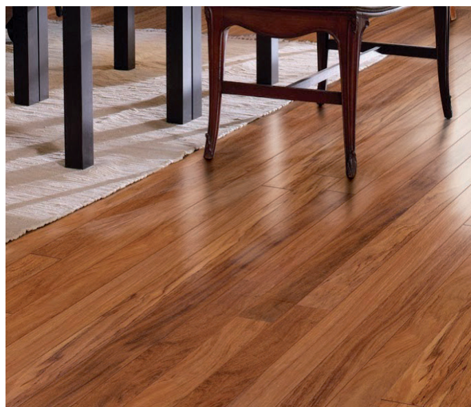
Applicazione su parquet – Oléofloor Classic –

Dopo ogni carteggiatura aspirare meticolosamente con un aspiratore prestando particolare attenzione alle aree dove la polvere tende ad accumularsi (battiscopa,