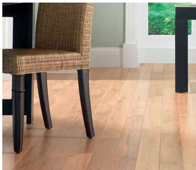
Applicazione su parquet in sala da pranzo – Oléofloor Classic –

Pulire accuratamente con SPACENETT. Carteggiare con grana 150. Pulire accuratamente con un aspirapolvere.