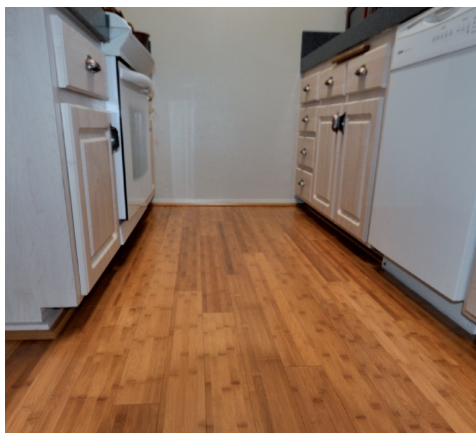
Applicazione su parquet in cucina – Oléofloor Classic –

Fare riferimento alla scheda di sicurezza disponibile su www.owatrol.pro/it e alle indicazioni sulla latta. Tenere fuori dalla portata dei bambini.